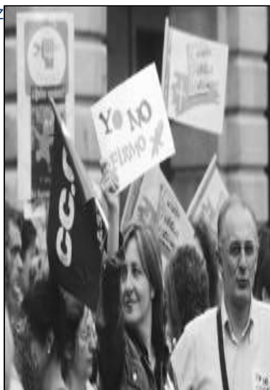
Protestas de trabajadores que no se apuntaron a la carrera.