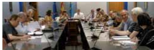
A la izquierda, los representantes del Usipa y Cemsatse, al fondo, cinco delegados de la Consejería, y a la derecha los del Sespa, CC OO y UGT. / J. DIAZ

UGT y CC OO le conceden dos meses para consensuar una norma que legalice los pagos y sea votada en la Junta