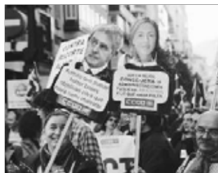
Protesta de sindicatos de profesores contra el Gobierno regional.

Los sindicatos mayoritarios exigen urgentemente una salida "legal y transitoria" para que los funcionarios que se acogieron a la carrera profesional sigan percibiendo el plus que anuló la sentencia del Tribunal Superior de Justicia de Asturias (TSJA). Y esta salida pasa porque el Gobierno convoque la mesa general en la que se firmó el acuerdo y se rehaga el mismo con el soporte de legalidad que pide el TSJA.