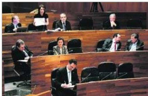
Un pleno de la Junta, donde también está vigente la carrera profesional.

En el caso del Consejo Consultivo, las fuentes del organismo consultadas por este periódico precisan que, en el mismo momento en que el Principado suspenda el abono de los pluses, se tomará una resolución en