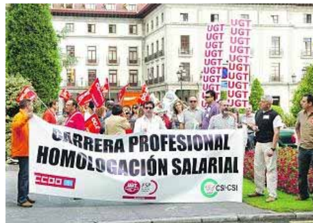
Una protesta de funcionarios.

De esa nómina se quedaron fuera unos 5.000 trabajadores. Aquí se incluyen los 2.200 que cumplen los requisitos para percibir los pluses y que costarían al Principado 6 millones más al año. El resto son interinos, empleados con menos de 5 años de antigüedad y algún caso particular, como el de los trasladados desde otras comunidades.