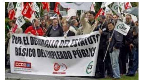
Manifestación organizada por los sindicatos, el curso pasado, reclamando el estatuto del empleado público.

La administración realizará mañana una segunda oferta en la mesa general