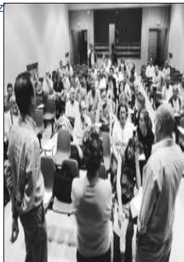
Asamblea de profesores ayer por la tarde en el IES Alfonso II.

Los profesores de Educación Secundaria Obligatoria (ESO) reclamarán en la calle el pago del complemento de 134,17 euros mensuales, que el Principado dejó de abonar a pesar de que este era fruto de un acuerdo alcanzado entre la administración y los sindicatos. Los sindicatos CCOO, FETE-UGT y ANPE mantuvieron un encuentro con varios de los cerca de 500 trabajadores afectados por el impago, en el que se acordó iniciar las movilizaciones.