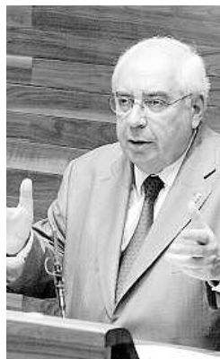
Vicente Álvarez Areces.

Vicente Álvarez Areces sustentó la fortaleza de la economía asturiana frente a la recesión en los datos del paro. «Somos la autonomía que menos empleo ha destruido desde el primer trimestre de 2007, un 2,3%, frente al 6,98 de la media española. El Presidente habló de «una clara recuperación de la compraventa de vivienda», del aumento de la ocupación turística en los meses de verano y de la concertación social como otros signos «del esfuerzo conjunto del Gobierno, sensato y eficaz, y de unos empresarios y unos sindicatos responsables» para sacar a Asturias de la crisis.