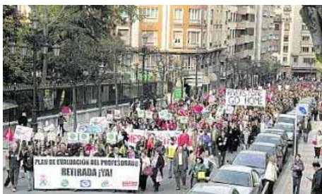
Una manifestación contra los planes de evaluación del profesorado.

Los sindicatos de la enseñanza llegan a la última fase de la negociación sobre su proyecto de carrera profesional divididos y blandiendo la amenaza de la movilización. Ayer, la tercera reunión de la mesa sectorial de educación sólo detectó avances en las dos brechas que ya estaban abiertas, la de las fuerzas sindicales entre sí y la de algunas de ellas con el Principado. La Administración, denuncian sus más vehementes antagonistas, no llevó al encuentro de ayer ninguna oferta nueva ni se mueve de su última postura, abrir desde el 1 de enero un nuevo proceso de evaluación al que se vincularía el pago de los complementos retributivos a los funcionarios que no los están cobrando, pero sin efectos retroactivos.