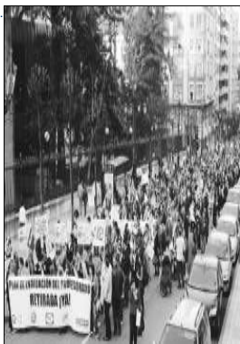
Protestas de los profesores contra el plan de evaluación.