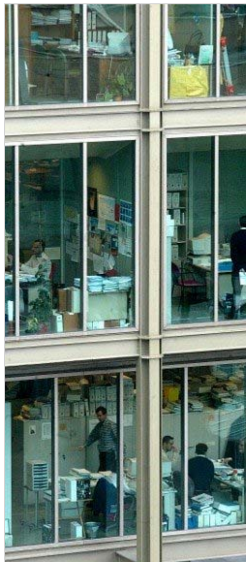
Funcionarios, en un edificio del Principado.

«Dimos la instrucción de que la gente no acogiese esa especie de 'cheque en blanco' detrás del que no se sabía qué había, pero hay que reconocer que más del 90% de los compañeros optaron por coger el dinero», recordaba ayer